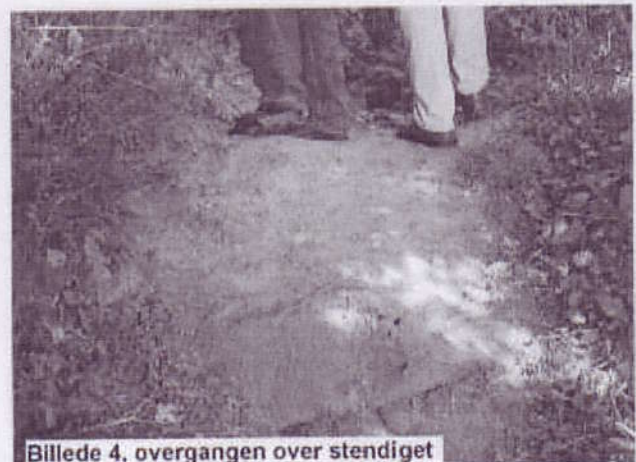
Billede 4, overgangen over stendiget