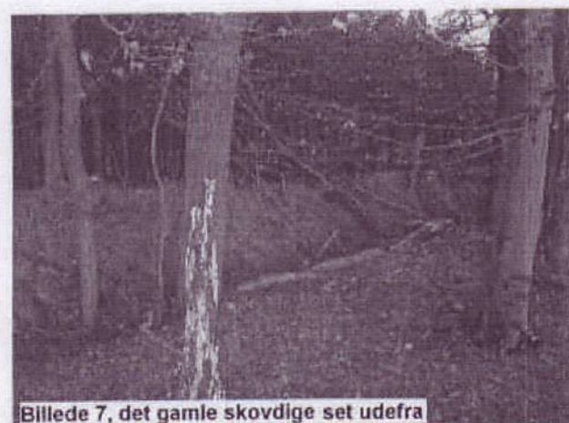
Billede 7, det gamle skovdige set udefra