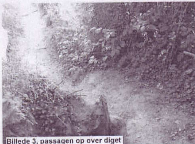
Billede 3, passagen op over diget