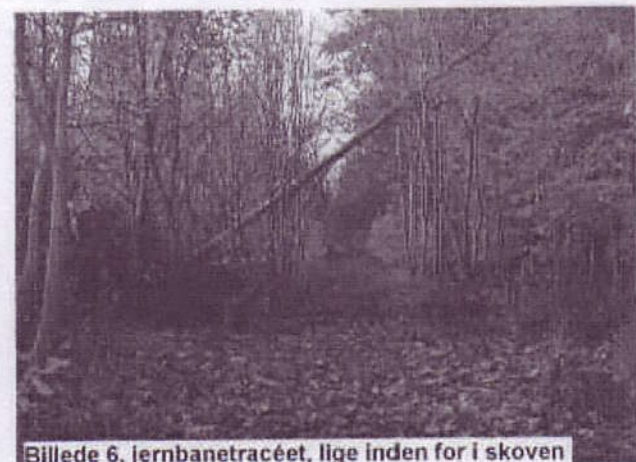
Billede 6, jernbanetracéet, lige inden for i skoven