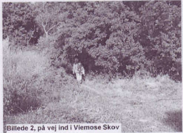
Billede 2, på vej ind i Viemose Skov