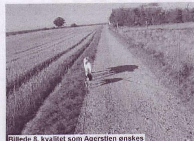
Billede 8, kvalitet som Agerstien ønskes