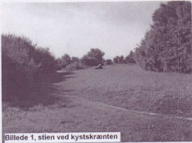
Billede 1, stien ved kystskrænten