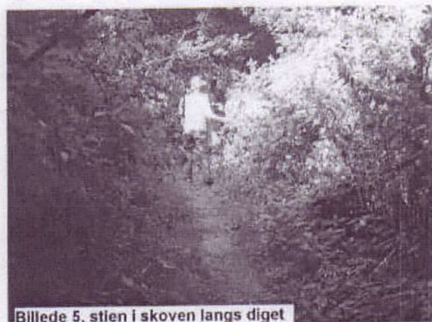
Billede 5, stien i skoven langs diget