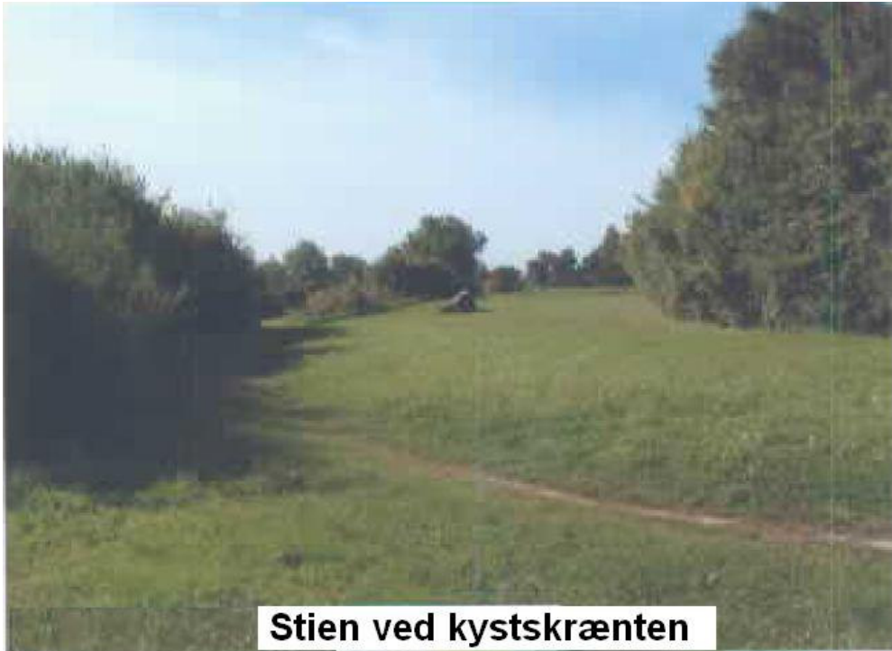
Stien ved kystskrænten