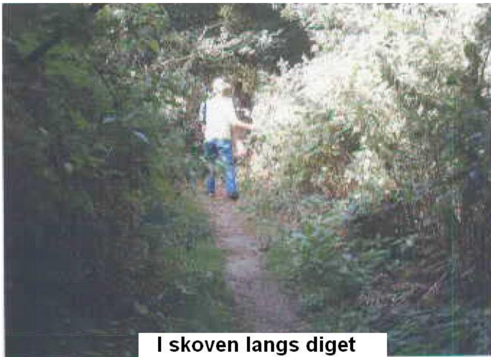
I skoven langs diget