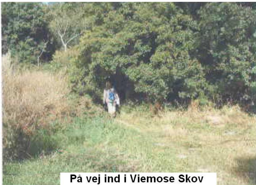
På vej ind i Viemose Skov