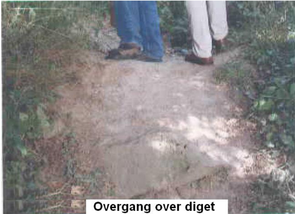
Overgang over diget